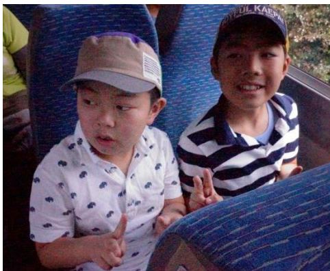
みんな元気にしゅっぱーつ！