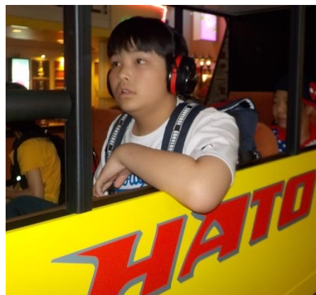
はとバスに乗ったり