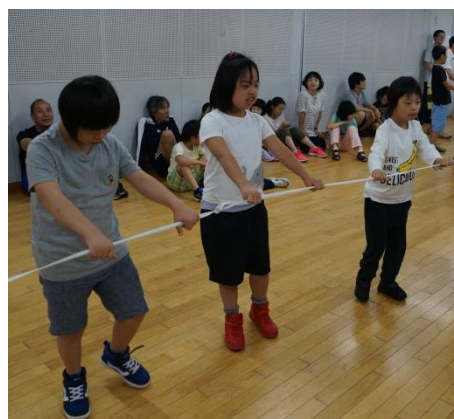
楽しいレクもやりました