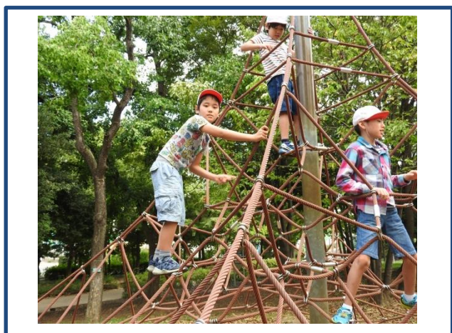
高いところからよく見えるよ。