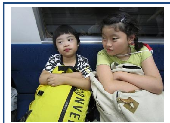
新宿西口駅まで大江戸線に乗りました。

木場公園では、今までやったことがないアスレチックに挑戦しました。深川江戸資料館では、江戸時代の体験をしました。事前学習の成果を発揮し、歩行や電車の乗り方も上手にでき、楽しい1日を過ごすことができました。