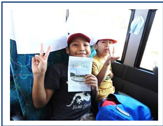
スクールバスに乗って出発！