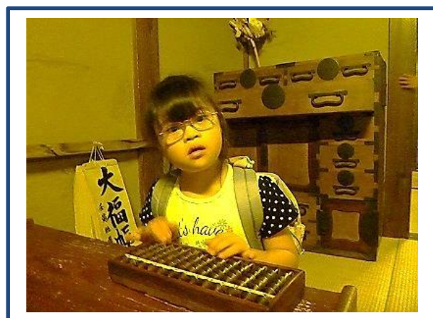
大きなそろばんだな。