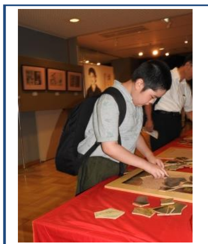
浮世絵のパズル、楽しいな。